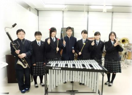
温かいご寄附で、念願の楽器 を購入することができました。 ありがとうございました。 （吹奏楽部一同）