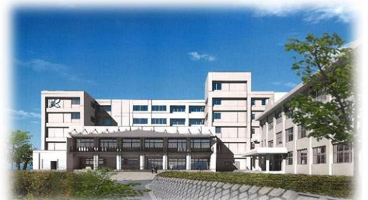
2020年新校舎完成を機会に魅力UPしたい！ 1階に開放型図書室を開館予定！