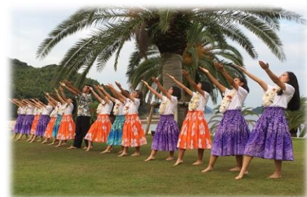
もっと活動の幅を広げたい！ （アロハフラ島高チーム）