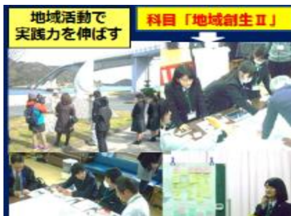
白木半島地区の夢プラン策定に協力！ もっと地域に役立ちたい！（地域創生科）

県外の皆様からの寄附先に、周防大島高校を指定された場合、 学力向上に有用な機器整備、部活動等で必要な物品の購入、地域と 連携・協働した活動に要する経費など、 周防大島高校の特色ある 教育活動等に活用させていただきます。