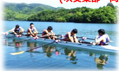
更なる強化をしたい！（ボート部など）